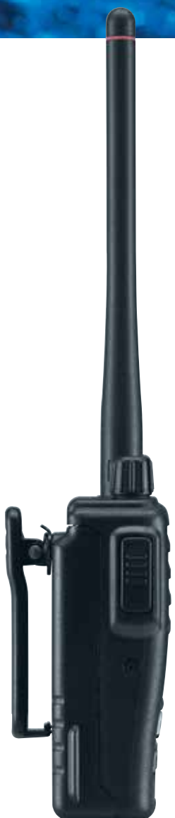
▼ IC-F51 ATEX