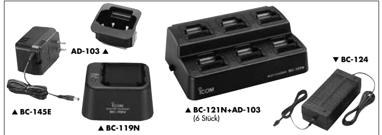
▲ BC-145E ▲ BC-119N ▲ BC-121N+AD-103 (6 Stück) ▼ BC-124

BC-150 TISCHLADEGERÄT + BC-147E NETZTEIL Normalladegerät, Ladezeit für BP-224 ca. 8 Stunden.