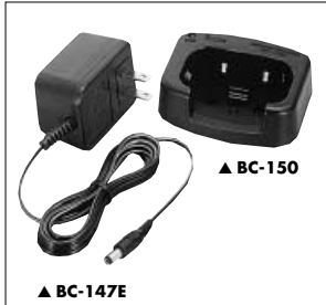
▲ BC-147E ▲ BC-150

BP-223 BATTERIEGEHÄUSE Gehäuse für R6 (AA)×6 Alkalinezellen BP-224 AKKU-PACK 7,2-V/750-mAh-NiCd-Akku-Pack. Es ermöglicht ca. 8 Stunden Betriebszeit. Senden (hoch):Empfangen:Standby=5:5:90