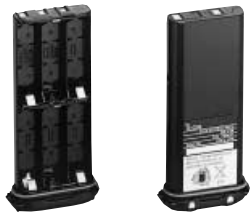
▲ BP-223 ▲ BP-224

BP-223 BATTERIEGEHÄUSE Gehäuse für R6 (AA)×6 Alkalinezellen BP-224 AKKU-PACK 7,2-V/750-mAh-NiCd-Akku-Pack. Es ermöglicht ca. 8 Stunden Betriebszeit. Senden (hoch):Empfangen:Standby=5:5:90