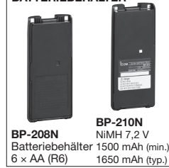
BP-208N Batteriebehälter 6 × AA (R6) BP-210N NiMH 7,2 V 1500 mAh (min.) 1650 mAh (typ.)