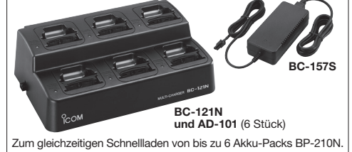
BC-121N und AD-101 (6 Stück) Zum gleichzeitigen Schnellladen von bis zu 6 Akku-Packs BP-210N.