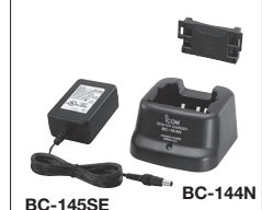
BC-145SE BC-144N Zum Schnellladen des Akku-Packs BP-210N in etwa 2 Std.