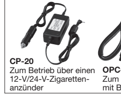
CP-20 Zum Betrieb über einen 12-V/24-V-Zigarettenanzünder OPC-656 Zum Betrieb mit BC-121N