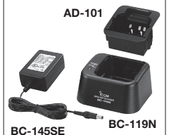
AD-101 BC-145SE BC-119N Zum Schnellladen des Akku-Packs BP-210N in etwa 2 Std.